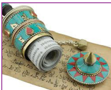
Moulin de prière Tibétain

Quand on a demandé à Newberg s'il pensait que Dieu était une perception générée par l'esprit ou si le cerveau se connectait pour expérimenter la réalité de Dieu, il a répondu : "La meilleure et la plus rationnelle des réponses que je puisse donner à ses deux questions est simplement OUI".